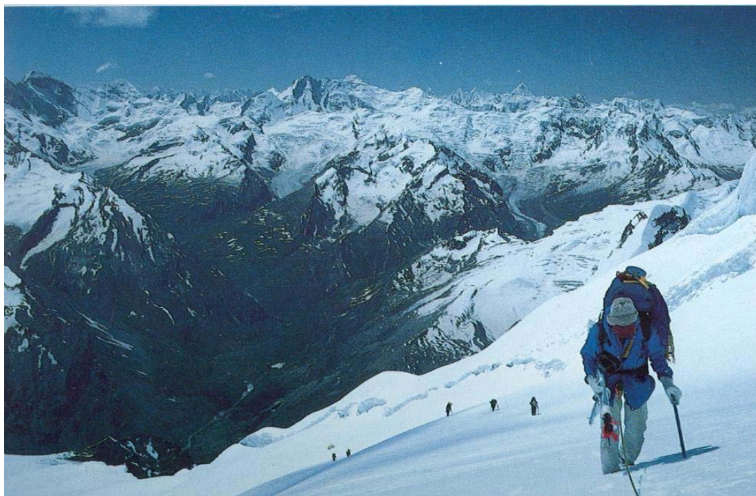
شرایط معمول تر تابستانی در نمایی که بیشتر به سمت جنوب شرقی است. دره پایین (که در تصویر قبلی در منتهاالیه سمت راست دیده می شود) رود کریشنای است، این همان مسیری است که گروه اکتشافی سال ۱۹۵۳ از طریق آن به تیغه غربی رسید.

کلود کوگان همچنان به عنوان یکی از معدود زنانی باقی مانده است که اولین صعود را بر روی یکی از قله مهم انجام داده است. با کمی تغییر در کنایه معروف مومری، این مسیر مسیری آسان است که آقایان در یک روز و بدون دردسر آن را صعود می کنند؛ تا امروز تیم های زیادی، اغلب از سمت شمال، این مسیر را صعود کرده اند. با این حال صعود کنندگان هندی که دومین صعود را بر روی نان انجام دادند، یال شرقی، از سمت فلات برفی، که پر شیب تر است را برگزیدند. در سال ۱۹۷۸ نیز یک تیم ژاپنی تیغه شرقی را صعود کرد، با این تفاوت که آن ها از مسیر جیمز والر برای صعود وایت نیدل و از یخچال شفات به آن رسیدند. صعود مکرر این مسیر از سال ۱۹۷۸ تاکید بر این موضوع است که این مسیر نسبت به یال غربی، کوهنوردی جذاب تری را نوید می دهد.